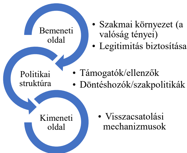
2. ábra Szakpolitikai döntéshozatal módosított modellje, Easton, 1990 alapján, saját szerk.

kérésére, a gyakorlati oldalról érkező visszajelzések hatására módosulnak, vagy éppen cserélődnek fel. Az „ideális jogalkotási” folyamatok a gyakorlati élet valóságából indulnak ki, a politikai akarat feltétlen érvényesülése helyett racionális döntéseken alapulnak. A férőhelyek jelentős csökkentését többek között azzal a szakmapolitikai érvrendszerrel erősítették, hogy a megfelelő gyógyszeres kezelések rendelkezésre állnak, nincs szükség tartós intézeti elhelyezésre. Az akkori ellátórendszer túlzottan intézményspecifikusan működött, 1994-ben még 12 039 pszichiátriai ágy volt országosan, majd 2006-ra már csupán 9 308 94 . A statisztika jól tükrözi azokat a folyamatokat, amelyek az elmebetegségről és a gyógyításról kialakultak az 1990-es évektől. Ennek ellenére túl gyors és drasztikus volt az a folyamat, amely a nagy, jól szervezett és reformra szoruló, de ellátásra alkalmas intézmények megszüntetéséhez vezetett, a nagy kórházbezárásokhoz, jelentős ágyszámok csökkentéséhez vezetett, nem csupán az OPNI-t érintette, hanem más bel-illetve gyermekgyógyászati intézményt is. Fontos megemlíteni a Svábhegyi Állami Gyermekszanatóriumot, a Budai MÁV Kórházat, a Szent Rókus Kórházat (utóbbi kettőben az aktív ágyszámok megszüntetése volt a cél). Számos más intézményt is érintett vidéken is ez a hullám, amely sok kisebb város aktív ellátást biztosító intézményének elvesztésével is járt, és a kapacitások jelentős szűkítését jelentette.