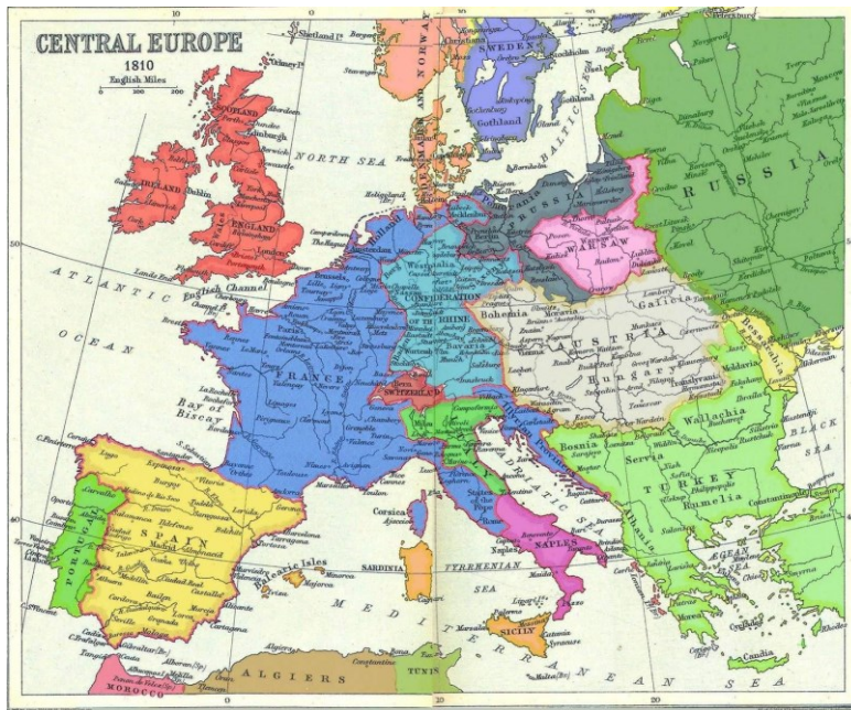
Central Europe in 1810, France took Tyrol from Austria, Croatia and a part of Slavonia from Hungary in accordance with the Treaty of Schönbrunn (1809)

In September, Archduke Karl Ambrosius died unexpectedly in Tata – he had visited soldiers in hospitals before and was infected by typhoid fever –, Leopoldina mentions her sadness over the death of her beloved uncle in the letter written to her father from Eger. 83 The activity of the imperial and royal family in Eger was well documented in the letters written by Marie Louise. The Peace Treaty of Schönbrunn 84 (1809) was signed by Francis in the Esterházy Palace (Tata), Napoleon forced Francis to cede important Austrian and