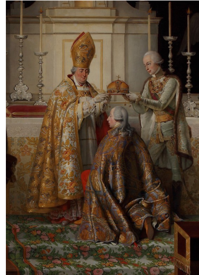
The coronation of King Francis I of Hungary in Buda (1792) by Cardinal Count József Batthyány, Archbishop of Esztergom and Archduke Alexander Leopold of Habsburg, the Palatine of Hungary (the last one with the insignia of the Order of St Stephen of Hungary) by Johann Peter Krafft

Of course, after the first news about French Revolution they suspended their activity, and left the masonry immediately (1789) to demonstrate that they do not agree with the radicalized movement. 33 The execution of Louis XVI of France and Marie Antoinette (1793) caused a real shock in Vienna, the known members of the masonry were removed from the public offices, later they were persecuted by the authorities. After the Martinovics Conspiracy 34 (1794), on the urging of Archduke Alexander Leopold of Habsburg, the Palatine of Hungary, the monarch