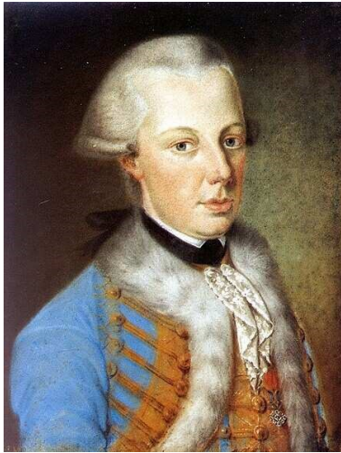
Archduke Alexander Leopold of Habsburg, the Palatine of Hungary in traditional Hungarian dress, by unknown painter (18 th century)

decided to ban the freemasonry (1795) both in Austria and in Hungary. 35 Next year (1796) Francis convoked the Diet, in his invitation letter he talked openly about the threatening dangers, 36 which phrases remained part of the passed Act too: