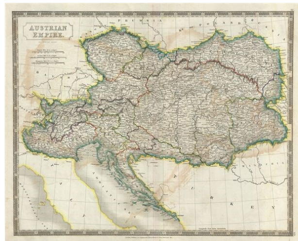
Austria and Hungary (1835)

The origin of the connection between the House of Habsburg and the Kingdom of Hungary goes back to the Middle Ages, to the reign of Rudolf I of Habsburg, King of the Romans (1273–1291), the founder of the dynasty. 6 The throne of Hungary was occupied by the House of Habsburg (after 1780 officially Habsburg-Lorraine) for centuries, for the first time between 1437 and 1457, and later continuously from 1526 to 1918. 7 Although the (inter)national historiography refers to the ‘Habsburg Monarchy’ (1526–1848) in Central Europe as a state, in reality it never existed as a realm. It would be much better to talk about the Habsburg Power in Central Europe. There was no common legislature, no common executive or juridical power, no common government, no common army, no common territory, no