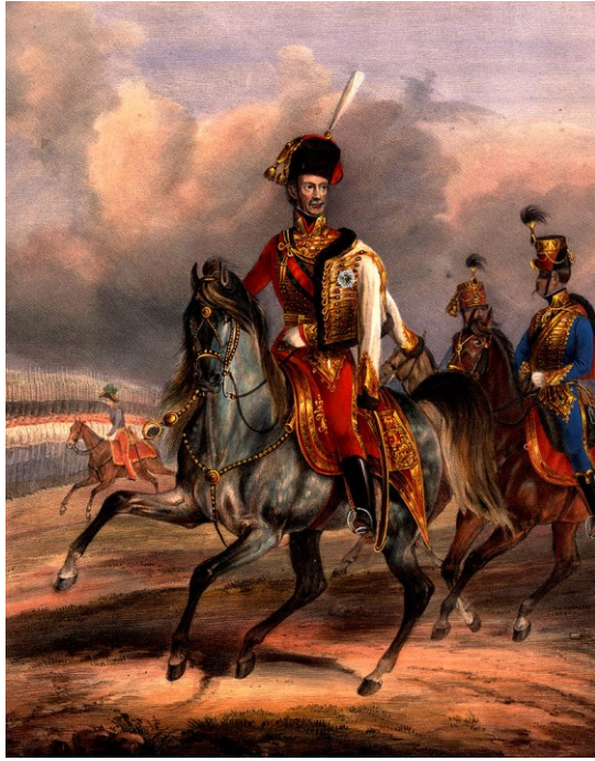
Archduke Joseph of Habsburg, Palatine of Hungary (1796–1847) in Hungarian Hussar uniform by Dietrich Monten (19 th century)

Moreover, the bilateral relation which had deteriorated during the second half of the reign of Queen Maria Theresa and mostly under the illegal usurpation of Emperor Joseph II before, was set right under Kings Leopold II and Francis. During the reign of Francis the use of the Latin as official language in public administration was confirmed, so was the use of Hungarian