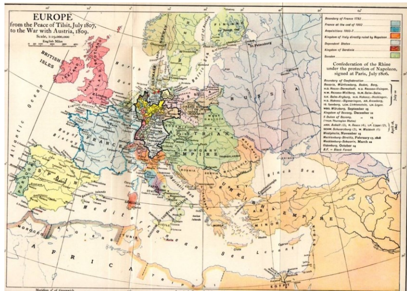
Europe after the Peace of Tilsit (1807)

French Revolution and the Napoleonic Wars, which affected the most of Europe. 42 Napoleon had been pressing Francis to dissolve the Holy Roman Empire for years, and finally obligated him (1806) to do so, from that point (1804) onward Francis started to use the hereditary title Emperor of Austria , which made him a so-called ‘doppelkaiser’ (double emperor). 43 Royal