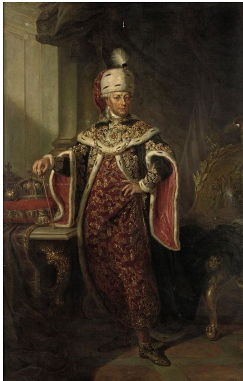
Emperor and King Francis dressed to the grand master of the Order of St Stephen of Hungary (19 th century) by Franz Xaver Stöber

It is a fact that the union with Austria (so called ‘Habsburg Monarchy’) – with full of political and economic conflicts – was not the smaller bad, but the only option and guarantee for Hungary in the threatening shadow of the Ottoman and Russian Empires at that time. Despite the numerous true statements of the Napoleonic Proclamation (the illegal and harmful actions of the imperial administration against Hungary, its illegal interferes to the Hungarian internal affairs, the notorious violation of the Hungarian constitution, and so on) a rebellion against the Habsburgs was not a reality in the country at that time. Why? The Kingdom of Hungary was liberated by the Habsburgs at the end of the 17 th century from the Ottoman occupation of more than 150 years (1541–1699/1718). The 18 th century – thanks to the Rákóczy’s War of Independence (1703–11) and its result, the Compromise of Szatmár (1711) – proved to be a golden age for Hungary. Those decades secured the rebirth of the nation, the