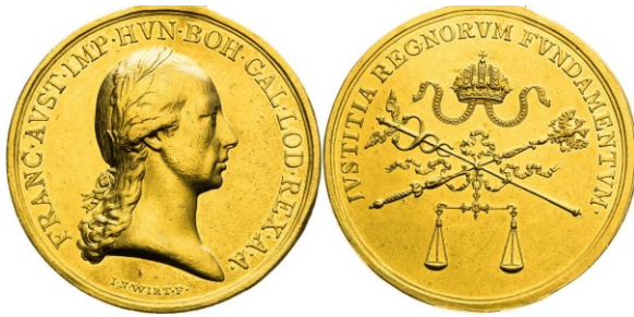
'Iustitia regnorum fundamentum'

ancestors came always, let's held a real National Assembly and let me know about your decision". 64