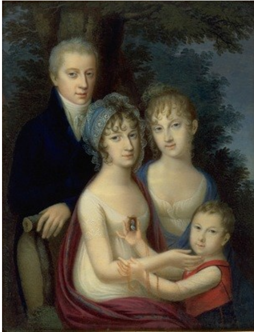
Empress and Queen Consort Maria Ludovica (sitting in the middle) with the children, Archduke Ferdinand (left), Archduchess Maria Leopoldina (middle) and Archduke Francis Karl (right) by Bernhard von Guérard (c. 1810)

battle of Győr), the reform of the institution was cancelled forever by the Habsburgs. 79 On 16 June Empress and Queen consort Maria Ludovica came to Eger – the archbishop of Eger, Baron