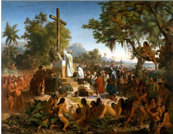
The first Holy Mass in Brazil (April 26, 1500), on the beach of Coroa Vermelha, in Santa Cruz Cabrália (Bahia), painted by Victor Meirelles (1860)

Brazil celebrated the 200th anniversary (1822) of its independence on 7 September 2022. For many in Hungary the Giant of South America means its prodigious beaches, landscapes, fantastic music, culture, legendary sport achievements, and unique gastronomy. In fact, it should mean much more for us. It is so memorable that o Cristo Redentor do Rio de Janeiro was “dressed” to Hungarian Tricolour in 2016 for the 100th anniversary of the coronation of Blessed King Charles IV of Habsburg (1916–1918) in Budapest. 1 In 2022 the President of Brazil, Jair Messias Bolsonaro made a historic state-visit to Hungary and in his